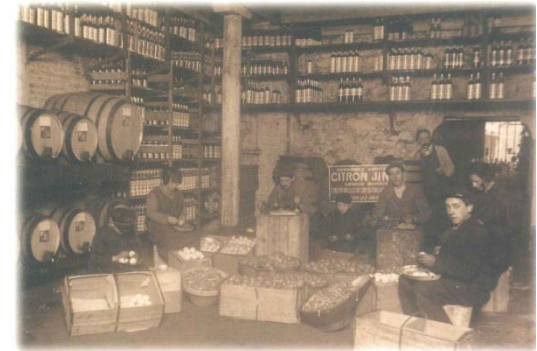
Zestage des citrons au début 1900

En 1885, afin de s'agrandir il installe son entreprise en Isère, terres d'origine de la famille Bigallet. En 1929, il rachète la distillerie Jinot de St Etienne.